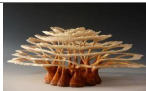
Figure 3 : Archipel, sculpture tournée, sculptée, texturée et sablée dans une loupe de robinier par Alain Maillard, tourneur et sculpteur sur bois