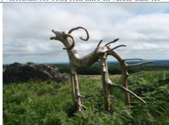
Figure 4 : Le grand cerf des monts d'Arrée, sculpture en bois brut réalisée par Michael Rimbault à partir d'un arbre mort

XX e siècle a été une période sombre pour le bois en France, les savoirs faire n'ont pas disparu et ont été largement décrits dans une littérature abondante aux XVIII e et XIX e siècles (Encyclopédie, ouvrages techniques et documents de cours spécialisés). Dans la même période, les ouvrages forestiers ( Flore de Mathieu, en 1877) décrivent encore la centaine de bois hexagonaux et leurs usages. Pour la Guyane, le laboratoire de sciences du bois de Kourou dispose de descriptions et d'échantillons pour environ 600 espèces, et les savoirs des populations autochtones et locales n'ont pas encore disparu. Beaucoup de bois récoltables dans nos forêts ont été qualifiés de bois précieux pour la facture instrumentale (épicea de résonance, érable ondé, buis, cormier), le tournage