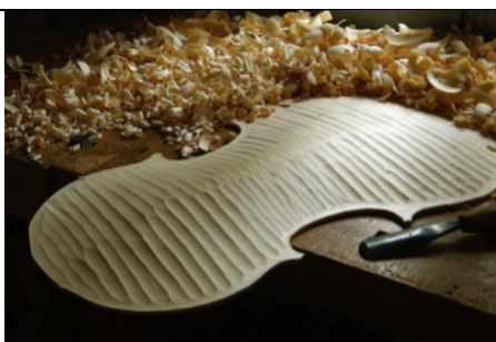
Figure 2 : Préparation à la gouge de la table d'harmonie d'un violoncelle de concert, épicea de résonance débité sur quartier. (Réalisation et photo Nicolas Gilles)

Dans les 114 000 entreprises répertoriées pour les métiers d'art 2 , les entreprises utilisant le bois comme matériau sont les plus nombreuses avec 20 000 unités représentant 28 000 emplois et un chiffre d'affaires de 5,4 milliards d'euros en 2024.