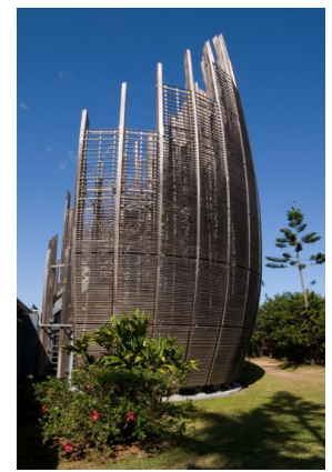
Figure 1 : Centre culturel Jean-Marie Tjibaou, Nouméa, architecte Renzo Piano, 1998, entreprise MATHIS.

L'une de ces familles intitulée "bois" regroupe 16 métiers, mais on trouve une présence significative du bois dans 40 autres métiers présents dans 11 autres familles (en facture instrumentale, 13 métiers sur 15 sont concernés par le bois) : les arts du spectacle (décorateur de théâtre), les arts et traditions populaires (charron), les arts graphiques (relieur, restaurateur de reliure et de tableaux), les arts mécaniques/jeux-jouets (fabricant et restaurateur d'automates, de jeux et jouets, de maquettes, d'objets miniatures, marionnettiste), la bijouterie-joaillerie-orfèvrerie-horlogerie (bijoutier fantaisie, fabricant et restaurateur d'horloges), la décoration (décorateur étalagiste, peintre en décor), la facture instrumentale (archetier, fabricant et restaurateur d'accordéons, de clavecins et épinettes, de harpes, de percussions, de pianos, d'instruments à cordes anciens, d'instruments à vent en bois, d'instruments de musique mécanique, d'instruments traditionnels, d'orgues, luthier, luthier en guitare), le luminaire (fabricant et restaurateur de lustres et d'abat-jour), les métiers liés à l'architecture (escalier, fabricant et restaurateur de charpentes, charpentier de marine, menuisier, parquetier), la mode (chapelier-formier-modiste, éventailiste) et la tabletterie (bimbelotier, brossier, fabricant de cannes, tabletier).